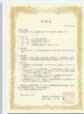
評価証 第15006号 (名称:「SQS被覆システム」)