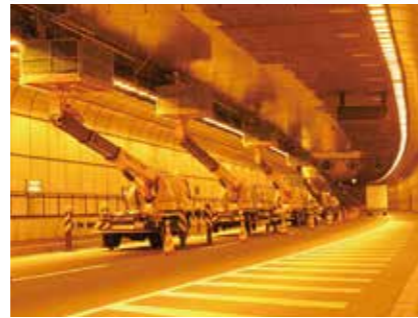
トンネル内剥落対策及び表面被覆工事