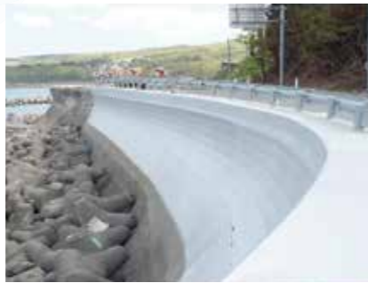
沿岸構造物表面被覆工事