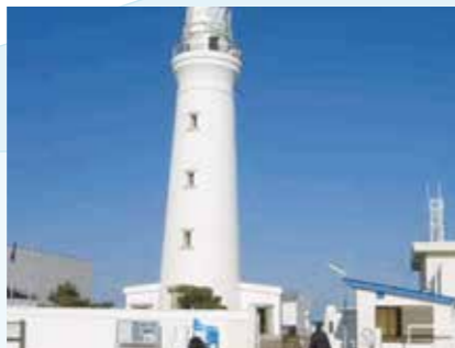
鋼製構造物に於ける表面被覆工事