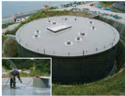
大型建築物地下防水工事