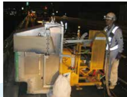
自動塗装機による壁高欄塗装工事