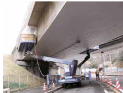
橋梁外部剥落対策工事