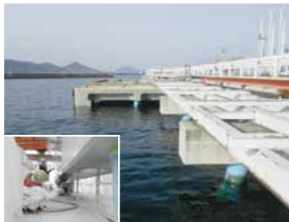
栈橋下面防食・塩害対策工事