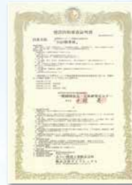
建設技術審査証明書 建技審証 第0422号 (名称:「SQS防水材」)