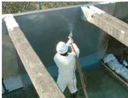
農業用三面水路有機系被覆工事