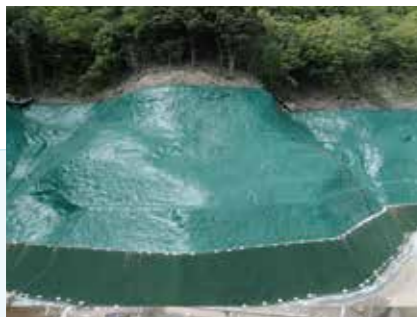
液状急斜面遮水シート工としての工事