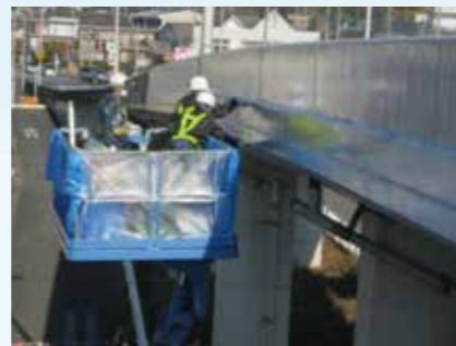
手塗一液型塗装材による工事