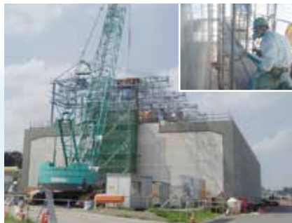
公共インフラの外防水工事